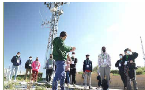
Visita al Campus de San Agustín de Guadalix