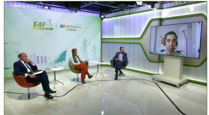
Energy for Future