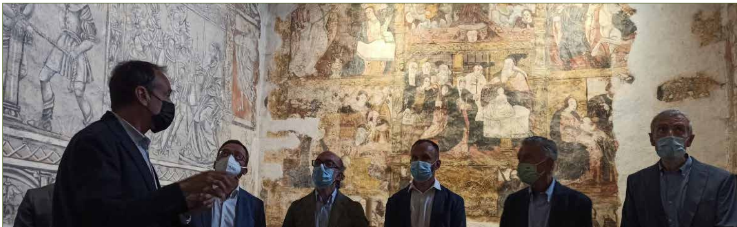
Iglesia salmantina de Carrascal de Velambélez