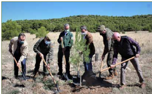
Campo de maniobras de Chinchilla

Inauguración de la reforestación del Campo de Maniobras de Chinchilla . Esta reforestación, la tercera que acomete la fundación dentro del plan Bosque Defensa-Iberdrola , ha supuesto la plantación a lo largo de una superficie cercana a 20 hectáreas de 17.000 árboles autóctonos, de los que un son 80% pinos y el 20% restante encinas – provienen del vivero “El Sembrador”, que desarrolla acuerdos con ONG para apoyar la inserción laboral de mujeres en riesgo de exclusión social. Estos árboles absorberán más de 2.500 toneladas de CO 2 a lo largo de su vida.