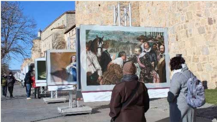
Prado en las calles

Tras el éxito de la exposición en Castilla – La Mancha, en 2021 – 2022 se traslada la exposición a nueve provincias de la región de Castilla y León: Salamanca, Valladolid, León, Aguilar de Campoo, Burgos, Soria, Segovia, Ávila y Benavente.