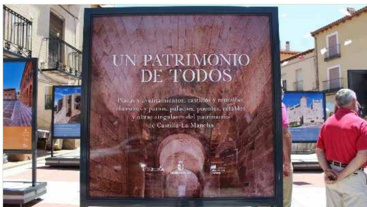
Un Patrimonio de todos

Ha itinerado por San Clemente (Cuenca), Manzanares (Ciudad Real), La Roda (Albacete), Pastrana (Guadalajara), Bargas (Toledo), Hellín (Albacete), Belmonte (Cuenca), Fuensalida (Toledo) y Calzada de Calatrava (Ciudad Real) y continuará en 2022 por 12 localidades más.